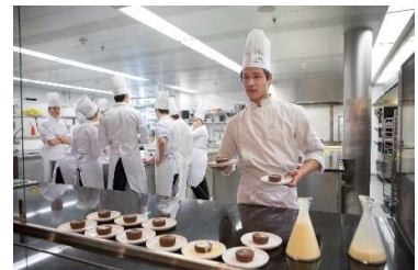
A l'école hôtelière 5 x 45 min