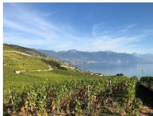
Une année à la vigne 4 x 52 min