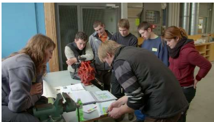
Les apprentis 5 x 45 min

Exemples déjà réalisés (pages.rts.ch/docs) :